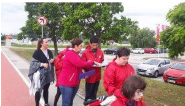
Szlovénia május 2020 – 3