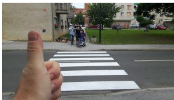
Szlovénia május 2020 – 2