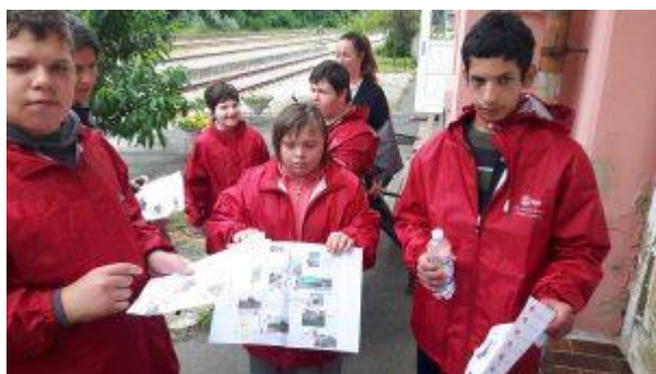
Szlovénia május 2020 - 1

Učenci so v okviru dneva dejavnosti preverili in utrdili pridobljeno znanje o prometu. Tekom šolskega leta so te vsebine spoznavali tudi v okviru projekta Erasmus +. Ob koncu pouka so izvedli zanimiv dan dejavnosti, kjer so bili pešči, kolesarji in še kaj.