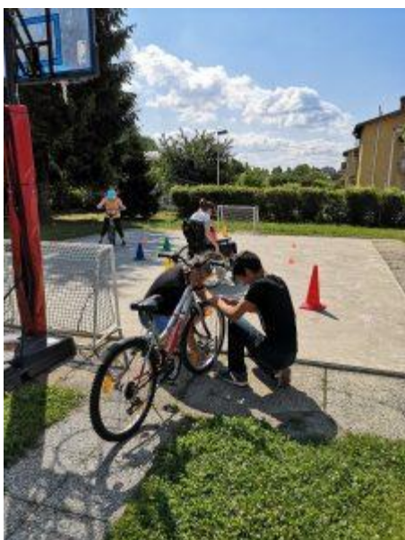
Szlovénia május 2020 – 5