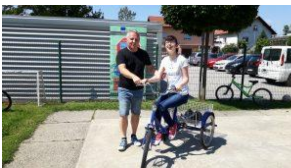
Szlovénia május 2020 – 6